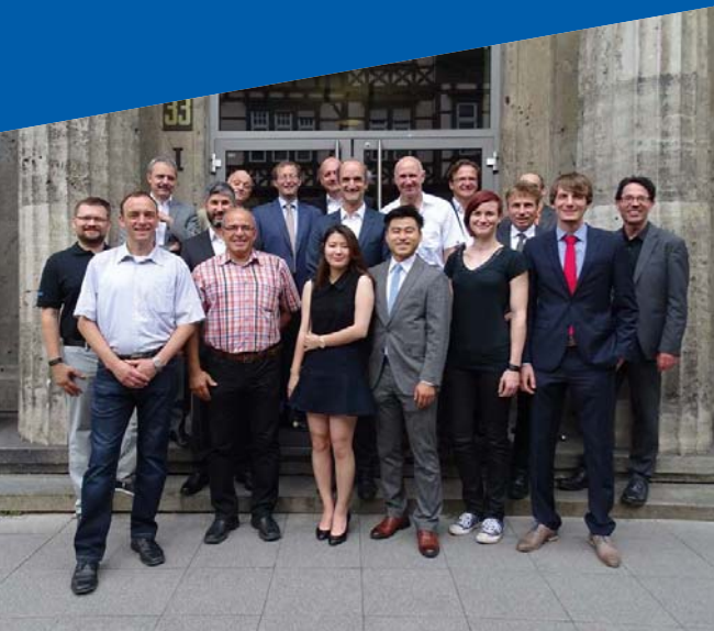
Rektoren der Mitgliedshochschulen, Dozenten und Absolventen des Masterstudiengangs Elektromobilität

Jede der Hochschulen verfügt über besondere Wissensträger und exzellent ausgestattete Labore, die in den gemeinsamen Masterstudiengang eingebracht werden.